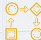
Structuren en werkprocessen