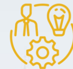
Mens en organisatie