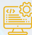
Technologie en systemen