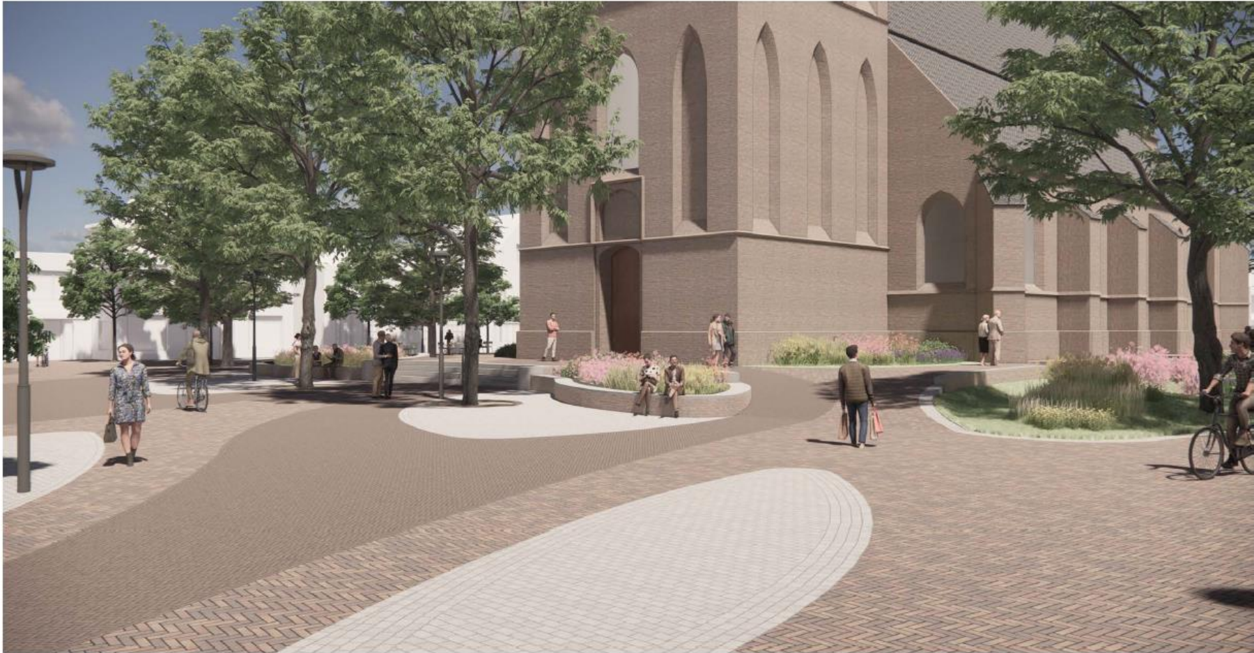
Afbeelding 6: zicht op het Kerkplein vanuit de Prinsenstraat. In deze hoek verdwijnt 1 boom om een mooi zicht te krijgen op de kerk