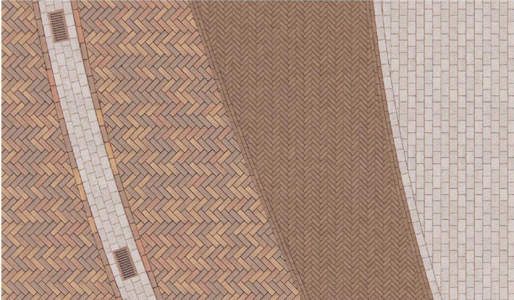
Afbeelding 8: detail van het bestratingspatroon. De huidige goot wordt vervangen door een geklinkerde goot met straatkolken.