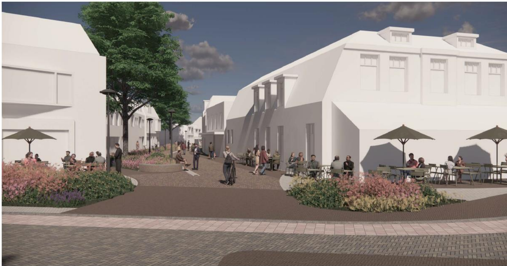
Afbeelding 2: Zicht op Prinsenstraat vanaf Raadhuisstraat. De entree wordt smaller gemaakt, er wordt groen toegevoegd