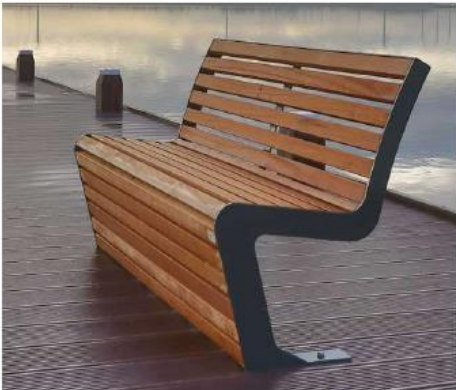
Falco Linea bank