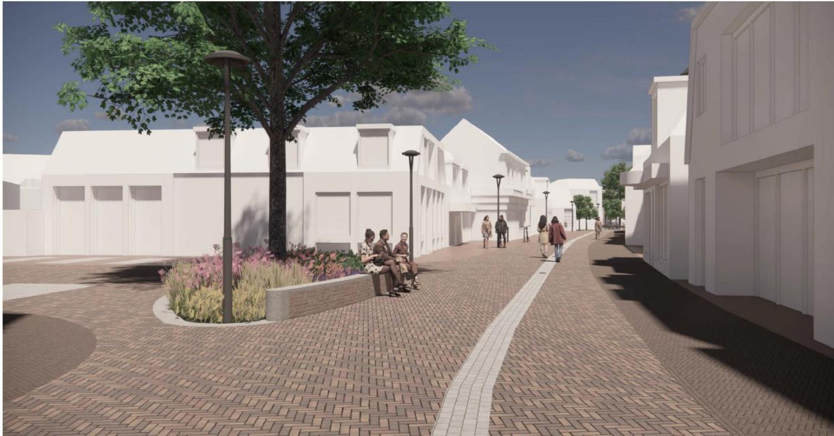
Afbeelding 3: zicht op noordelijk deel van de Prinsenstraat, ter hoogte van de aansluiting met de Molenstraat