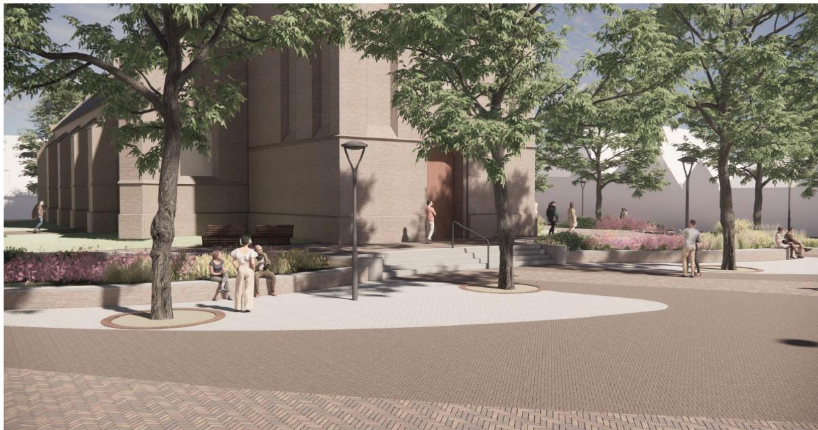
Afbeelding 4: Zicht op het Kerkplein vanaf de Hema. De marktfunctie op het Kerkplein blijft behouden. Rondom de kerk wordt nieuw groen toegevoegd en er komt meer ruimte voor terrassen en om te zitten.