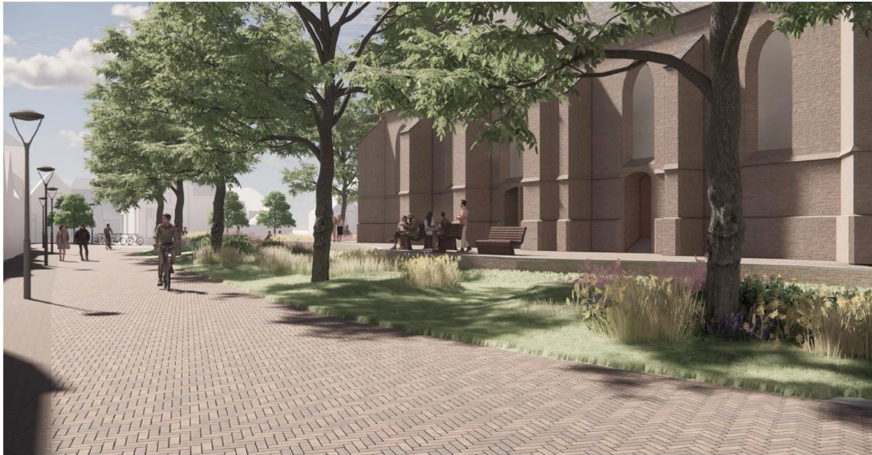
Afbeelding 7: zicht op het Kerkplein (vanaf bloemenwinkel richting Prinsenstraat). Het groen functioneert als wadi.