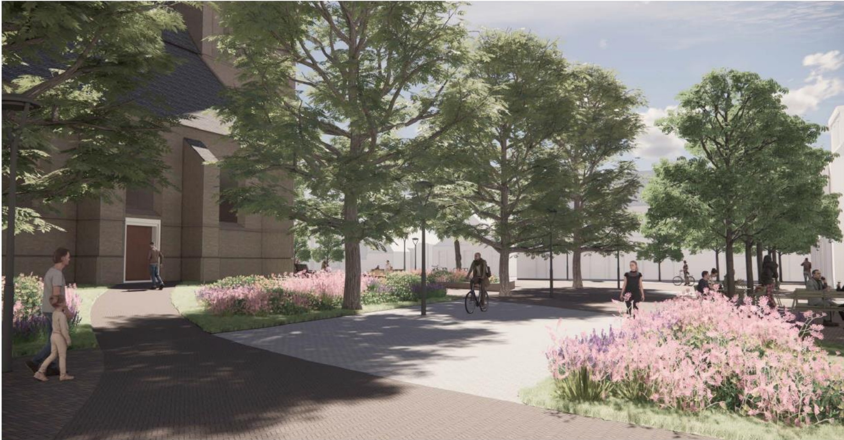
Afbeelding 5: Zicht op het Kerkplein vanaf de hoek van de Aldi. Dit is niet een afbeelding van het definitieve ontwerp. In het laatste concept definitief ontwerp worden aan deze zijde van het Kerkplein parkeerplaatsen toegevoegd. De gemeenteraad wordt in juni gevraagd te besluiten over de parkeervariant voor het Kerkplein