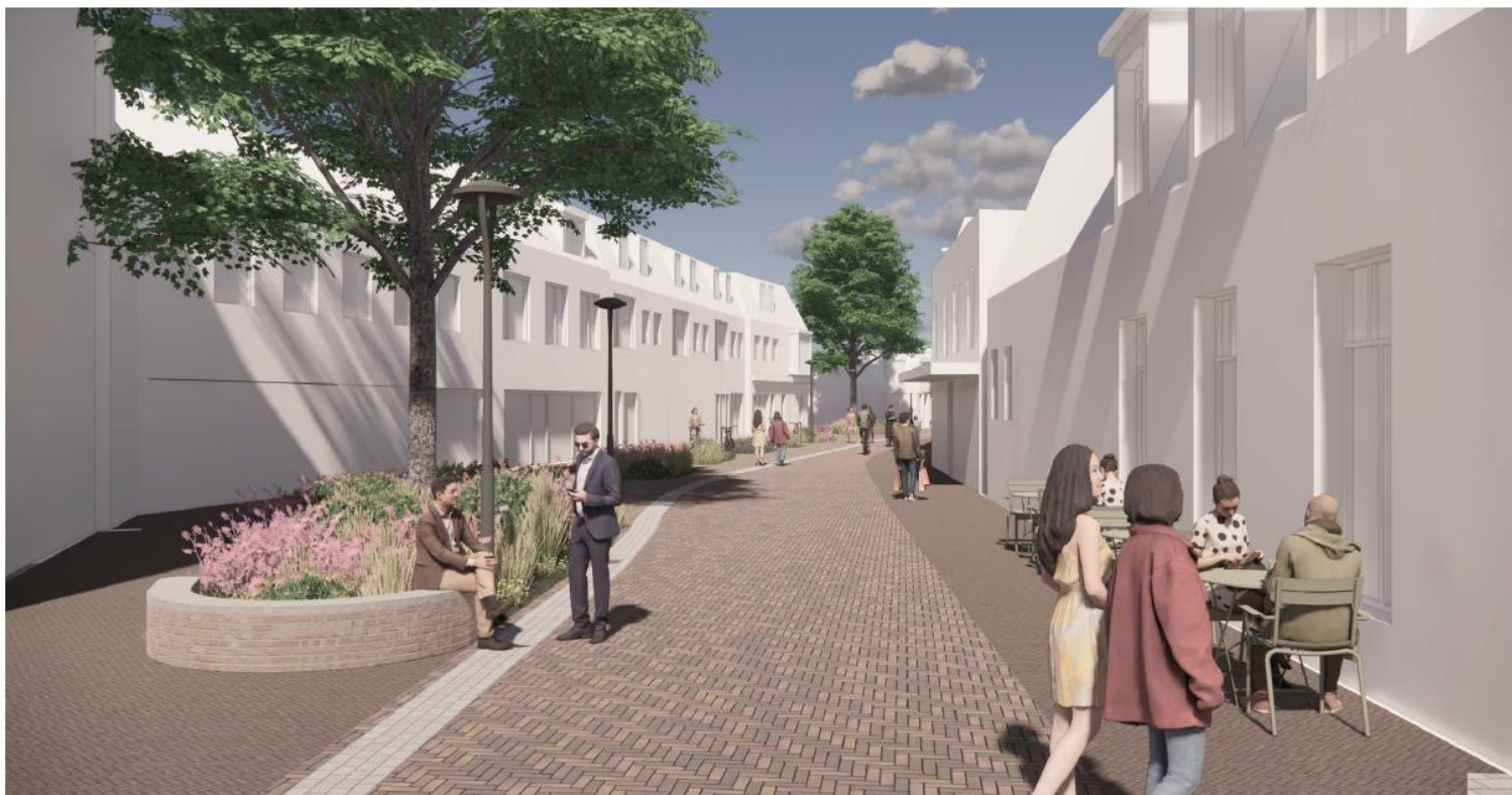
Afbeelding 1a: Zicht vanaf Prinsenstraat 2 in noordelijke richting