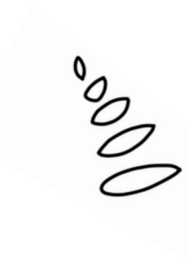
Klimaatwinkelstraat met natuurlijke vormen