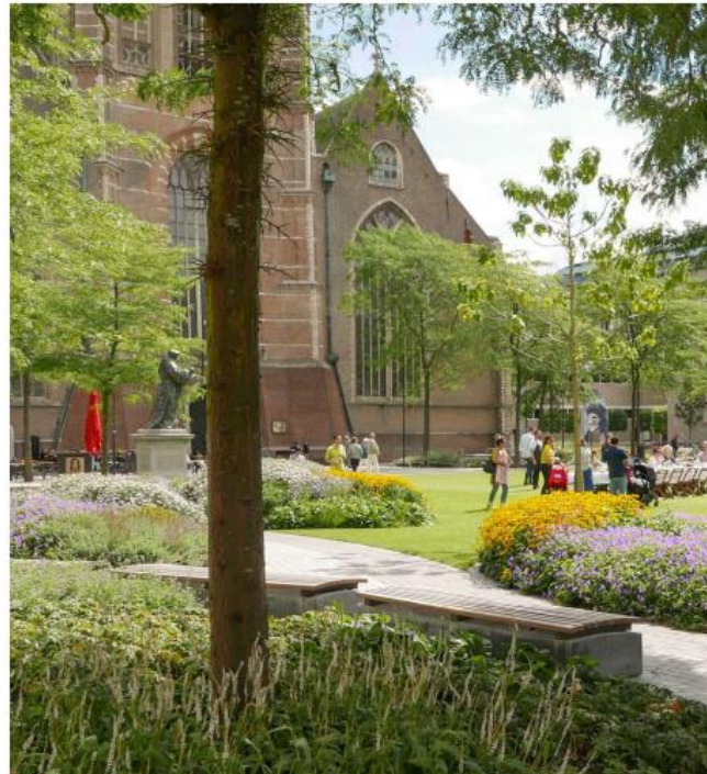
Voorbeelden van vergelijkbare inrichtingen