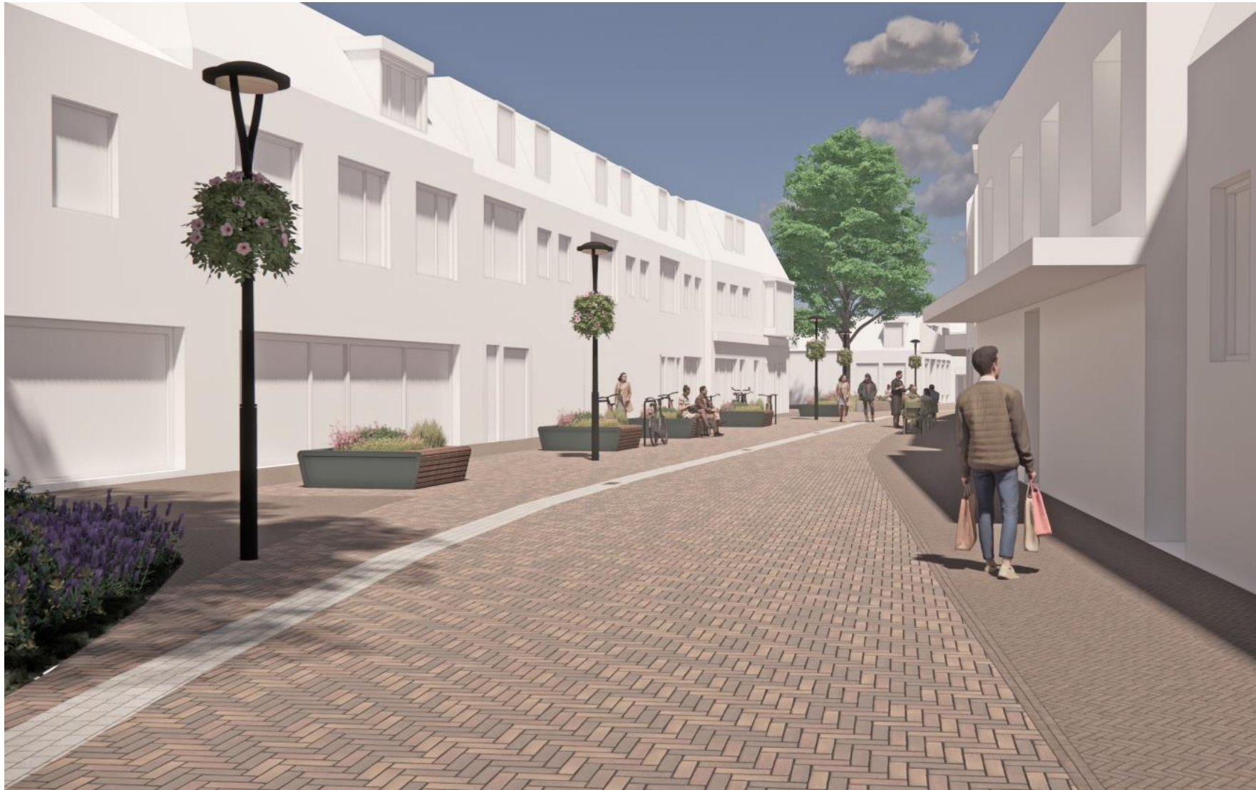
Afbeelding 1b: sfeerbeeld met plantenbakken i.p.v. plantvakken