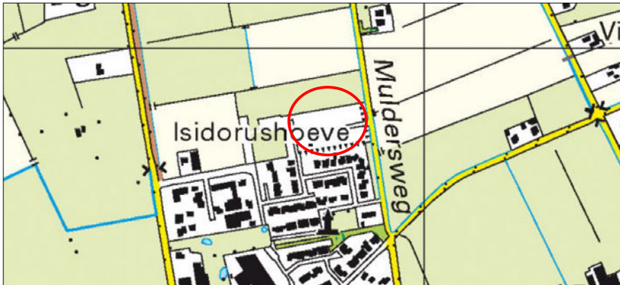
Globale ligging van het plangebied. De ligging van het plangebied wordt met de rode cirkel aangeduid.

Het plangebied ligt tussen de Muldersweg, 't Plaggenveld en Gersteland, aangrenzend aan het noordelijke deel van de woonkern Oudleusen, gemeente Dalfsen. Het plangebied ligt in het buitengebied van de gemeente Dalfsen en wordt omgeven door stedelijk- en landelijk gebied. Op onderstaande afbeelding wordt de globale ligging van het plangebied weergegeven op een topografische kaart.