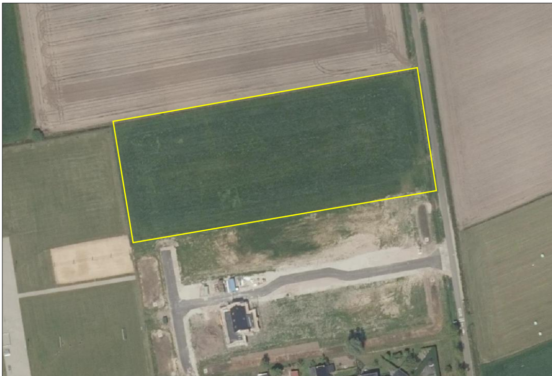
Begrenzing van het plangebied; deze wordt met de gele lijn aangeduid.

Het plangebied bestaat volledig uit agrarisch cultuurgrond, tijdens het veldbezoek in gebruik als grasland. Dit grasland bestaat uit een soortenarme vegetatie van Engels raaigras en wordt intensief beheerd. Het plangebied grenst met de oostzijde aan verharde weg en met de overige zijden aan agrarisch cultuurgrond. Op onderstaande luchtfoto is de begrenzing van het plangebied aangegeven. Voor een verbeelding van de huidige situatie wordt verwezen naar de fotobijlage.