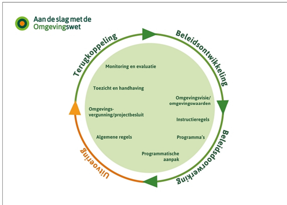
Figuur 1.1 De beleidscyclus