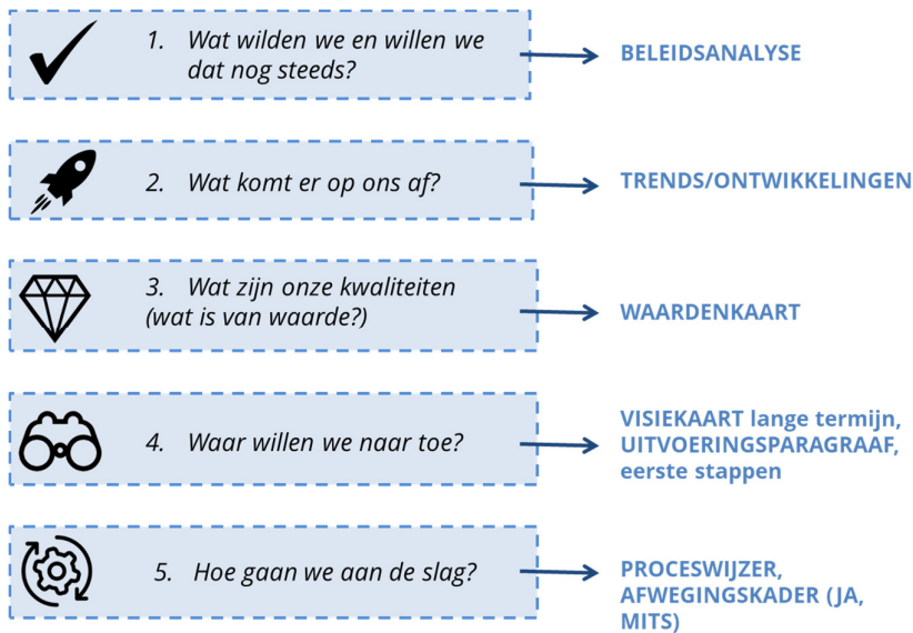
Figuur 1.2 Stappen Omgevingsvisie (bron: BügelHajema Adviseurs)

Na de Kadernota gaan we de opgaven aanscherpen, aanvullen en uitschrijven in een visie en een afwegingskader voor initiatieven. Op basis van de Kadernota en de beleidsinventarisatie maken we een waardenkaart met gebiedswaarden en toetsen deze tijdens de participatie (stap 3). Mede op basis van de inbreng tijdens de participatie worden gebiedsgerichte (kern-)visiekaarten gemaakt die opnieuw voorgelegd worden aan inwoners en stakeholders (stap 4). In hoofdstuk 5 is de aanpak van het vervolgtraject van de Kadernota beschreven.