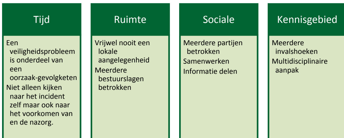
Figuur 1. Het in breder perspectief plaatsen van veiligheidsproblemen a.d.h.v. vier lijnen

Veiligheidsrisico's worden overal in de samenleving aangetroffen, thuis, op het werk en onderweg. De risico's kunnen niet vanuit één standpunt verholpen worden. Integrale veiligheid plaatst veiligheidsproblemen in een breder perspectief, een brede kijk op een specifiek veiligheidsprobleem. Dit wordt gedaan aan de hand van vier factoren 4 :