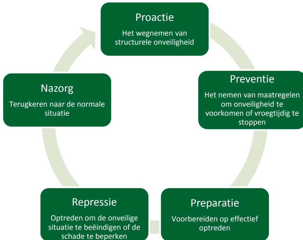
Figuur 2. De veiligheidsketen 5

Een veelgebruikt hulpmiddel bij het systematisch verminderen van risico's is de veiligheidsketen. Door het systematisch aanpakken van veiligheidsvraagstukken worden de veiligheidsrisico's zo ver mogelijk beperkt. Hierbij worden oplossingen gezocht binnen de financiële, praktische en ethische grenzen. De veiligheidsketen bestaat uit vijf schakels: proactie, preventie, preparatie, repressie en nazorg.