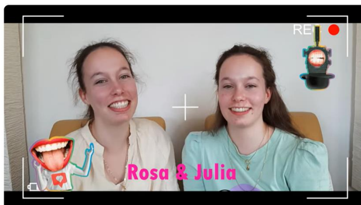
Aftermovie WAK 2023

Klik op het plaatje om de AFTERMOVIE van de WAK te bekijken. En zie wat er allemaal te doen was.