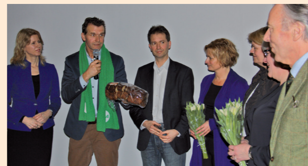
CDA delegatie uit Den Haag