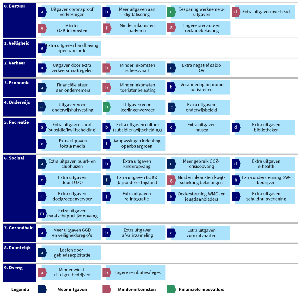
Figuur 1: overzicht financiële gevolgen coronacrisis voor gemeenten

Aan het begin van het onderzoek hebben we een bode inventarisatie gemaakt van alle inhoudelijke gevolgen die gemeenten ervaren als gevolg van de coronacrisis die (mogelijk) financiële effecten met zich meebrengen. Uit deze inventarisatie zijn in totaal 42 relevante gevolgen van de coronacrisis naar voren gekomen. De onderstaande figuur geeft deze weer.