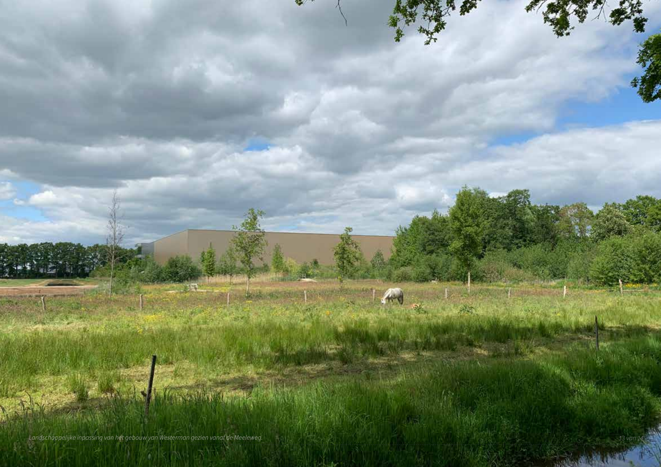
Landschappelijke inpassing van het gebouw van Westerman gezien vanaf de Meeleweg.