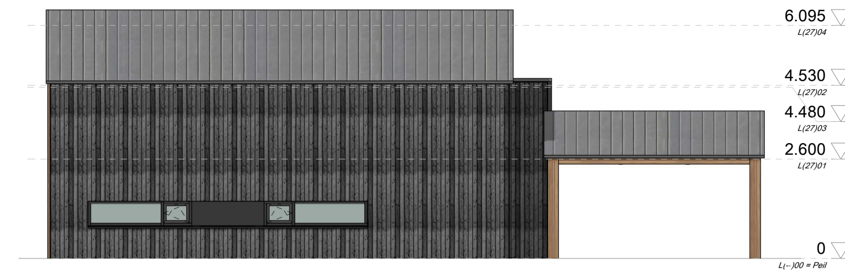
Westgevel 1 : 100