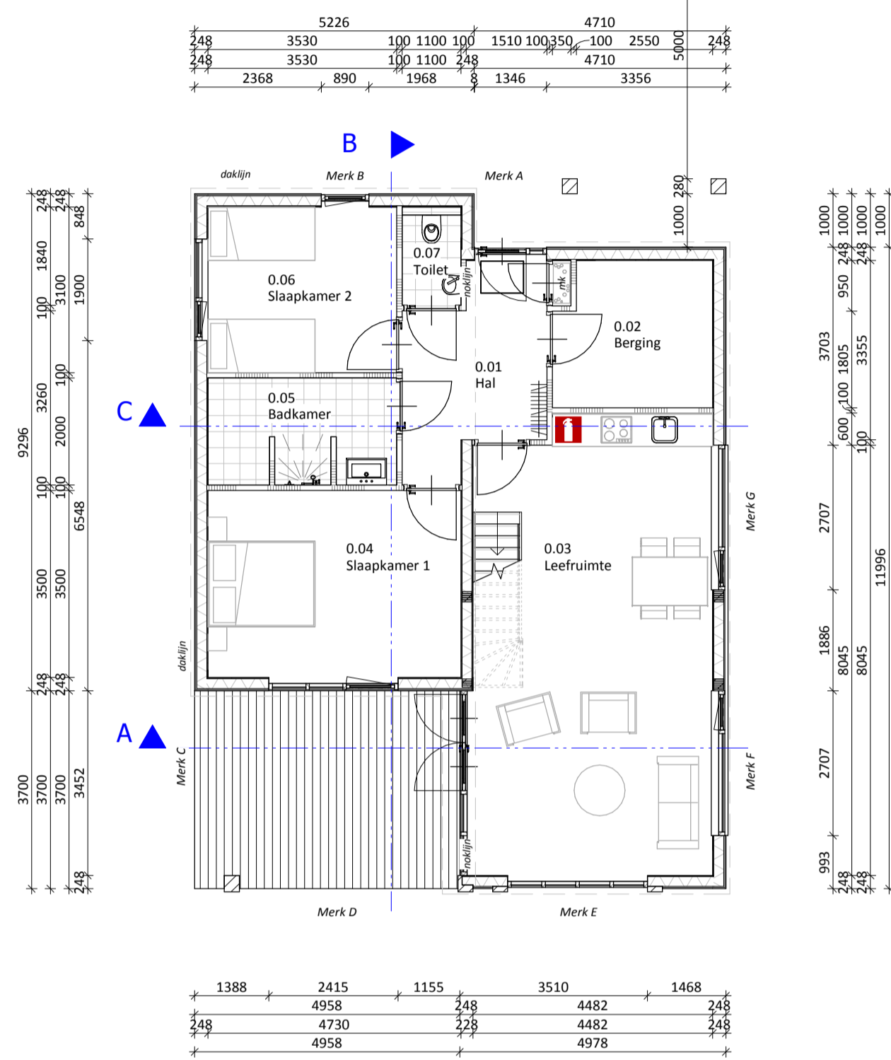
Begane grond 1 : 100