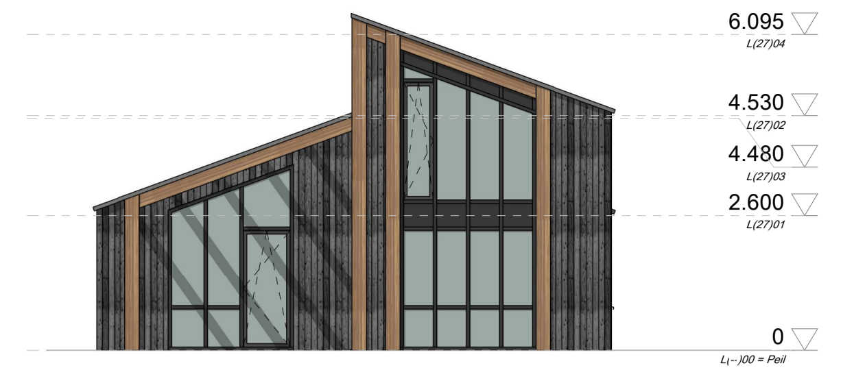
Noordgevel 1 : 100