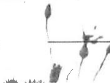
(naam en handtekening)