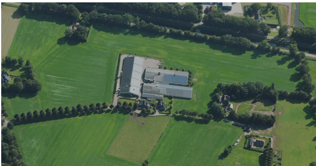
Figuur 1: Luchtfoto perceel te

Cliënt beschikt op de genoemde locatie over een agrarisch bedrijf in de vorm van een varkenshouderij. Op het desbetreffende perceel worden zeugen en biggen gehouden verdeeld over diverse stallen. Een kantoor/ hygiënesluis, berging, spoelplaats en twee bedrijfswoningen zijn eveneens aanwezig. De afgelopen jaren kent het bedrijf een duurzame ontwikkeling en cliënt wenst deze ook voort te zetten. Een actuele luchtfoto van het bedrijf wordt in navolgende afbeelding weergegeven.