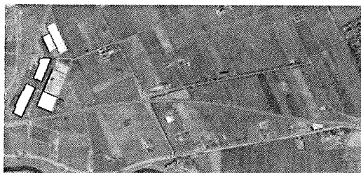
Figuur 3 Route bouwverkeer

De snelheid en lading bepaald de mate van trillingen en hinder. Er worden geen maatregelen getroffen om deze trillingen te beperken en/of de situatie vooraf vast te stellen. Wij voorzien dan ook schade door trillingen van de werkzaamheden, daar waar deze plaats vinden in de nabijheid van onze woning en de opstallen.