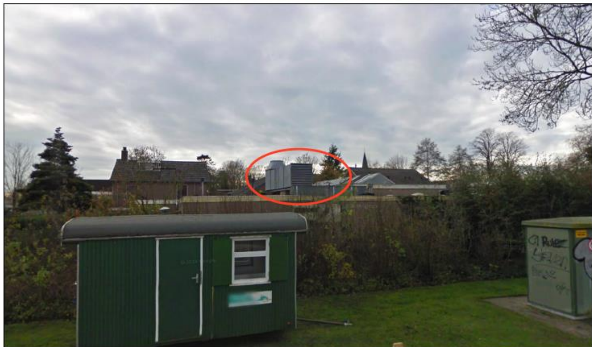
Afbeelding 4: Installatie inrichting Schoolstraat 44)

Het Activiteitenbesluit milieubeheer stelt – onafhankelijk van het aantal spuituren – eisen aan de afzuiging van het coaten van metalen in artikel 4.64 onder lid 4 van de “Regeling algemene regels milieubeheer” in de vorm van een keuze tussen: