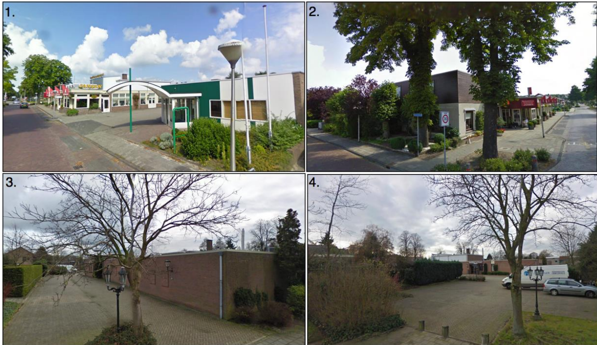
Afbeelding 2: Straatbeelden plangebied

Het geldende bestemmingsplan is 'Lemelerveld 2006'. Dit bestemmingsplan is op 24 september 2007 vastgesteld door de gemeenteraad van Dalfsen. Op basis van dit bestemmingsplan zijn de gronden in het plangebied bestemd voor 'horecadoeleinden' (artikel 19). De op de plankaart voor 'horecadoeleinden' aangewezen gronden zijn bestemd voor horecabedrijven als genoemd in de categorie 1 t/m 3 van de in de bijlage bij de regels opgenomen horecalijst, met dien verstande dat indien de gronden zijn aangeduid met horeca categorie 2 toegestaan uitsluitend tot en met deze categorie is toegestaan, met daarbijbehorende gebouwen, waaronder begrepen (bedrijfs)woningen - andere-bouwwerken, tuinen, erven, terrassen, terreinen, parkeervoorzieningen, water en groenvoorzieningen. Een gebouw mag uitsluitend in een bouwvlak worden gebouwd, waarbij de bouwhoogte niet meer mag bedragen dan de op de plankaart aangegeven bouwhoogte. Een uitsnede van de plankaart van het geldende bestemmingsplan is opgenomen in afbeelding 3.