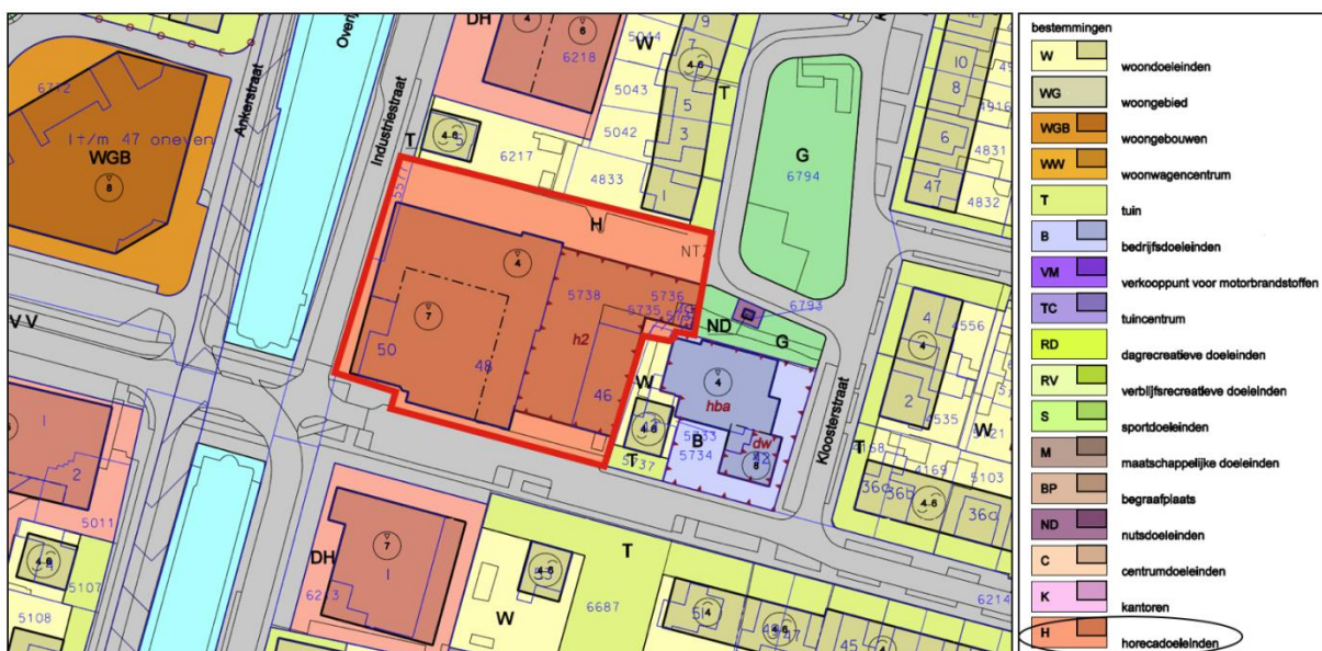
Afbeelding 3: Uitsnede plankaart bestemmingsplan 'Lemelerveld 2006' (Bron: Gemeente Dalfsen)

Het geldende bestemmingsplan is 'Lemelerveld 2006'. Dit bestemmingsplan is op 24 september 2007 vastgesteld door de gemeenteraad van Dalfsen. Op basis van dit bestemmingsplan zijn de gronden in het plangebied bestemd voor 'horecadoeleinden' (artikel 19). De op de plankaart voor 'horecadoeleinden' aangewezen gronden zijn bestemd voor horecabedrijven als genoemd in de categorie 1 t/m 3 van de in de bijlage bij de regels opgenomen horecalijst, met dien verstande dat indien de gronden zijn aangeduid met horeca categorie 2 toegestaan uitsluitend tot en met deze categorie is toegestaan, met daarbijbehorende gebouwen, waaronder begrepen (bedrijfs)woningen - andere-bouwwerken, tuinen, erven, terrassen, terreinen, parkeervoorzieningen, water en groenvoorzieningen. Een gebouw mag uitsluitend in een bouwvlak worden gebouwd, waarbij de bouwhoogte niet meer mag bedragen dan de op de plankaart aangegeven bouwhoogte. Een uitsnede van de plankaart van het geldende bestemmingsplan is opgenomen in afbeelding 3.