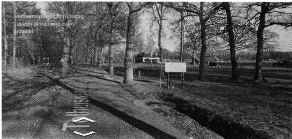
Verkeerspiegel aan de Tolhuisweg op een plaats met uitstekend uitzicht