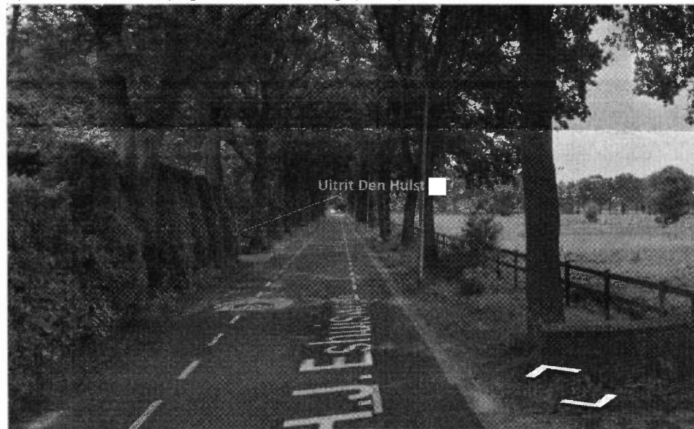
Situatie uitrit Den Hulst Nieuwleusen