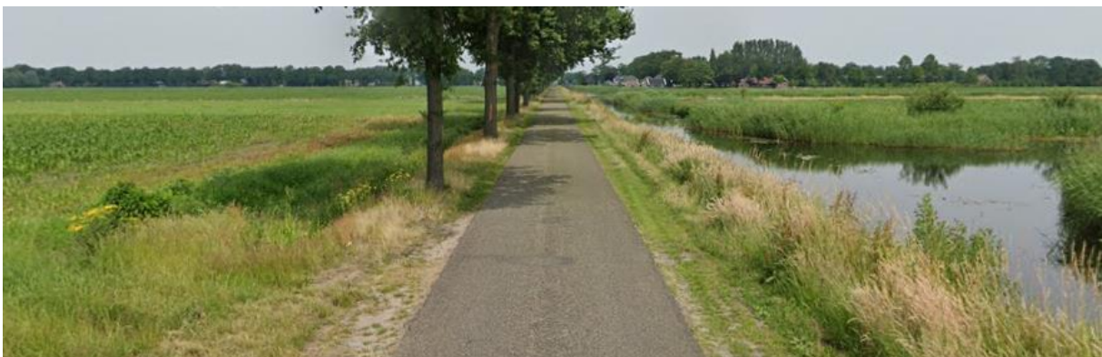
Buldersweg (situatie heden)