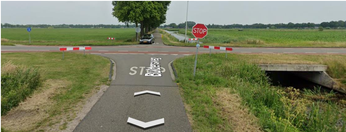
Buldersweg met kruising Beatrixlaan (situatie heden)

Naar aanleiding van de motie “Dorpsrondjes” ingediend op de raadsvergadering 31 oktober en 3 november (unaniem ondersteund door alle fracties), zijn bij ons, de Werkgroep Vergroenen (onderdeel van Nieuwleusen Synergie), de radertjes gaan draaien. Ons idee en advies is: de Buldersweg in Nieuwleusen wordt vanaf het Westerveen tot aan het Zandspeur een zandweg!