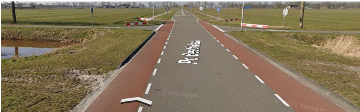
Beatrixlaan met kruising Buldersweg (situatie heden)