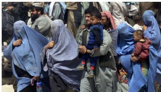
Women under the previous Taliban regime were forced to wear burkas and could not go out without a male relative