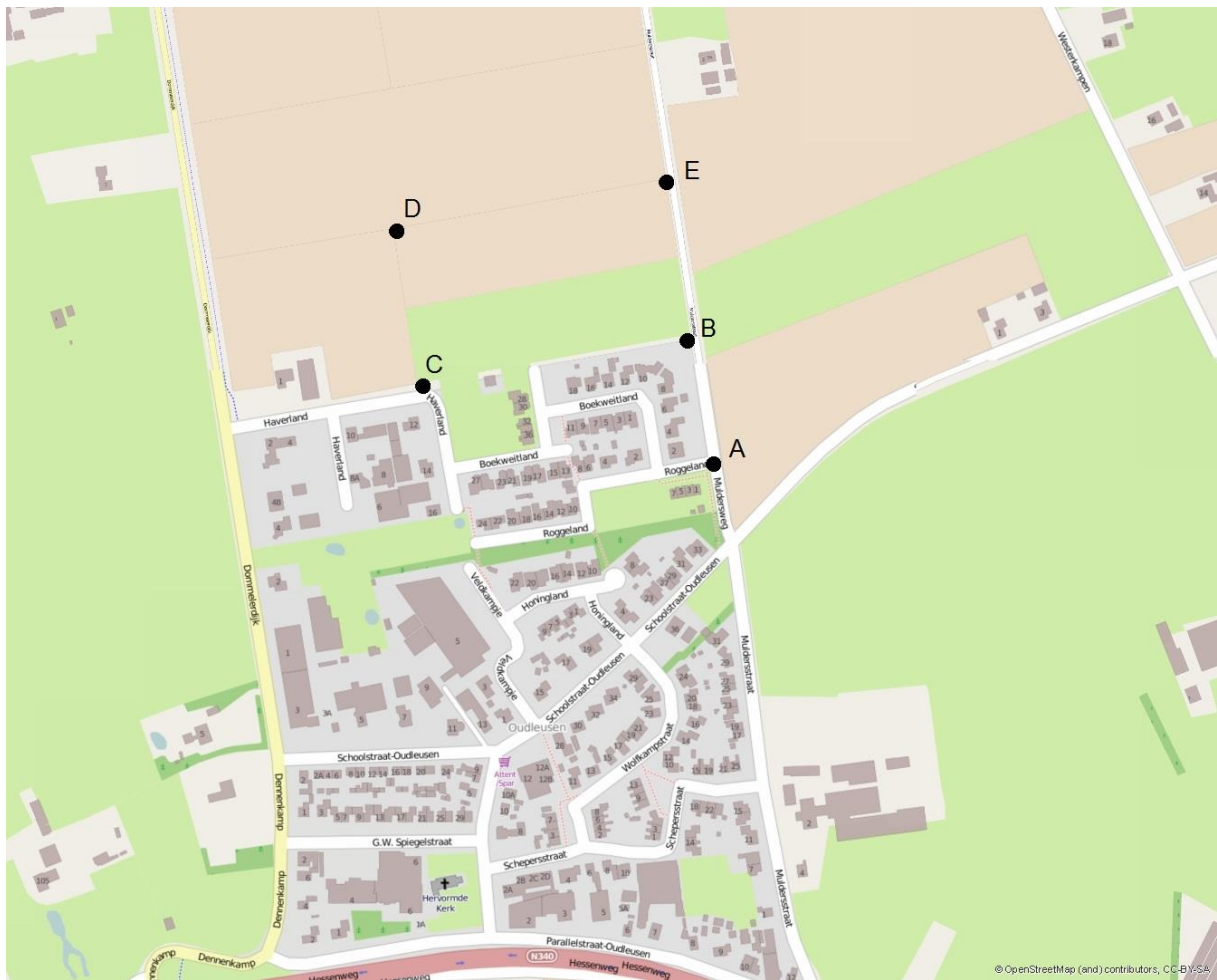
Figuur 3.1 Overzicht receptorpunten (hoekpunten van de te ontwikkelen woonwijk)