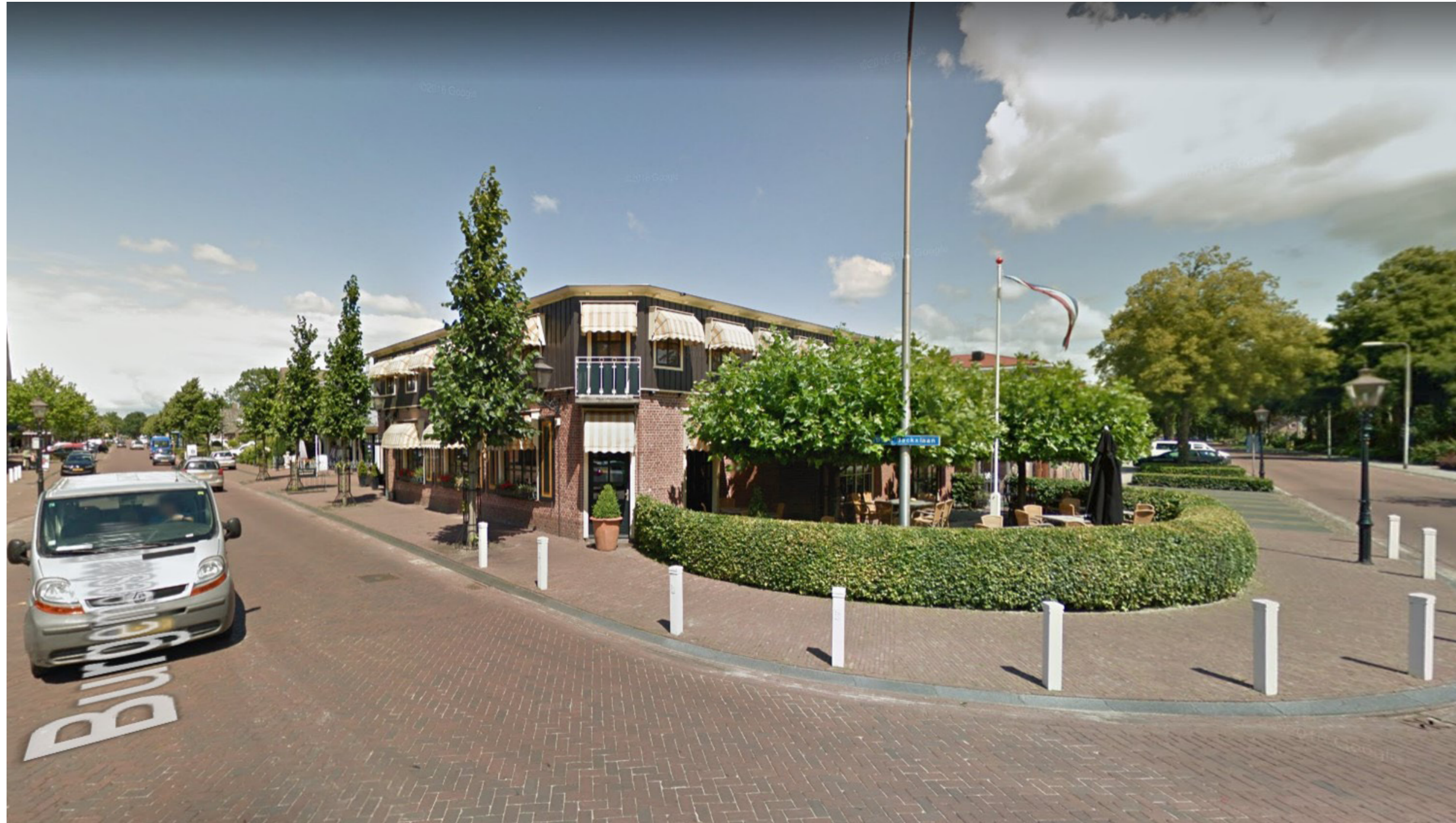
hoek Burgemeester Backxlaan - Oostende