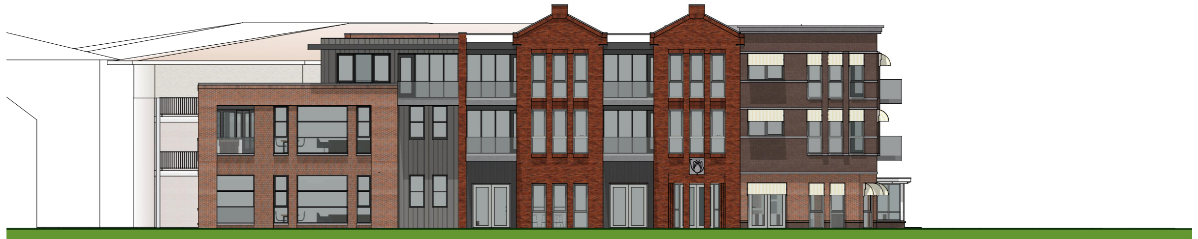
Westgevel - Burgemeester Backxlaan