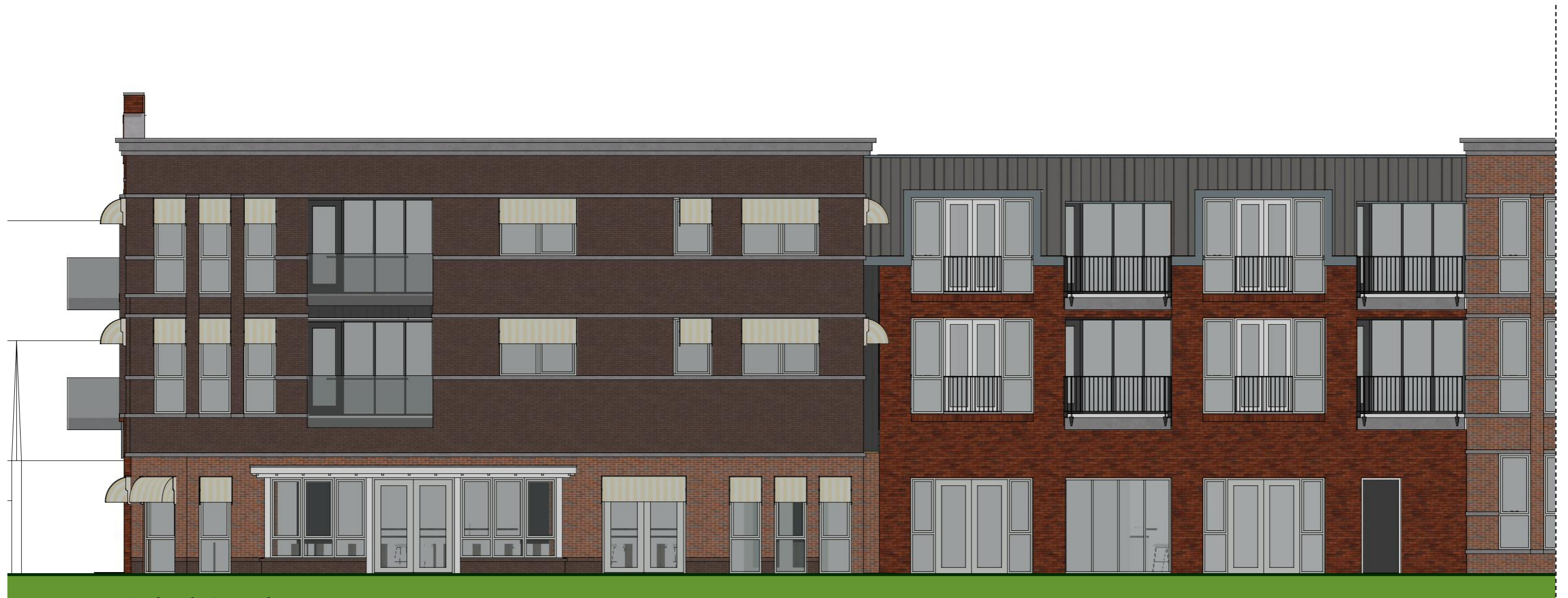
Zuidgevel - Oosteinde