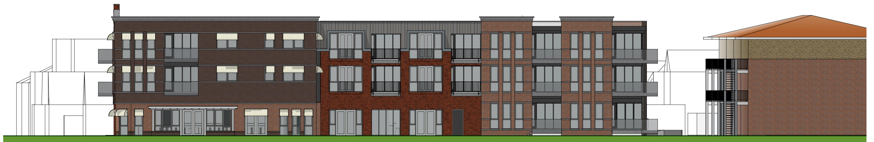
Zuidgevel - Oosteinde