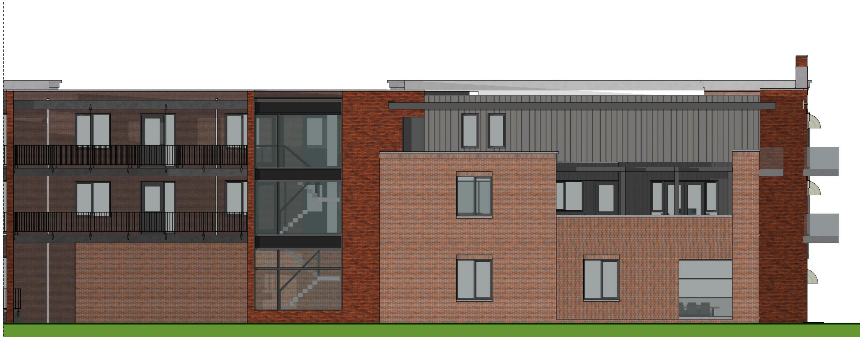
Noordgevel - binnenterrein/onderdoorgang