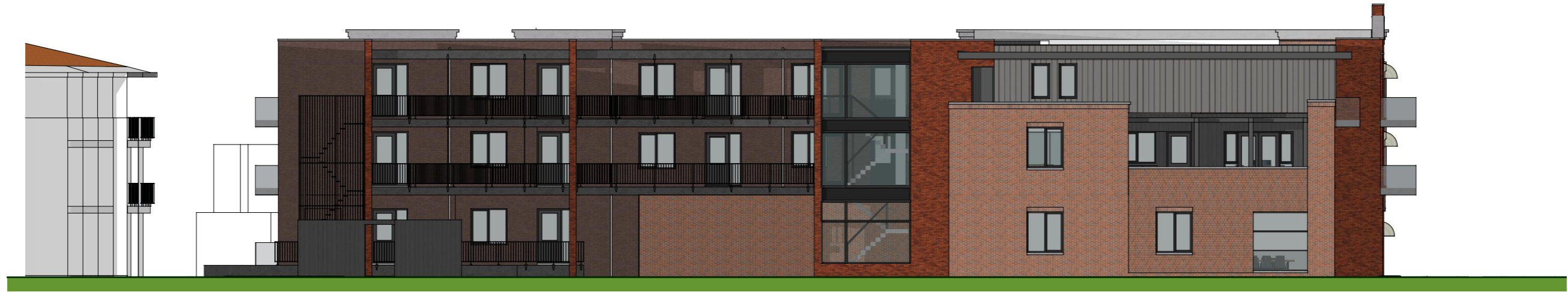
Noordgevel - binnenterrein/onderdoorgang