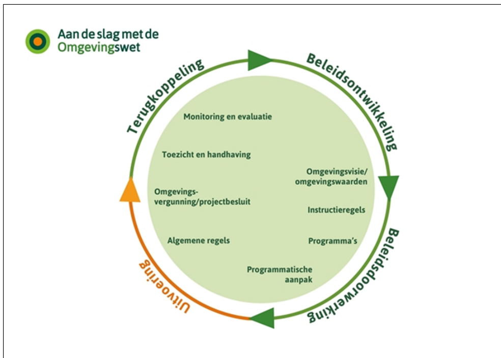
Figuur 1.1 De beleidscyclus