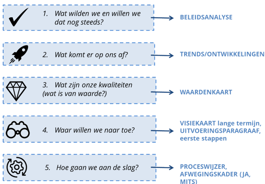
Figuur 1.2 Stappen Omgevingsvisie

Na de Kadernota gaan we de opgaven aanscherpen, aanvullen en uitschrijven in een visie en een afwegingskader voor initiatieven. Op basis van de Kadernota en de beleidsinventarisatie maken we een waardenkaart met gebiedswaarden en toetsen deze tijdens de participatie (stap 3). Mede op basis van de inbreng tijdens de participatie worden gebiedsgerichte (kern-)visiekaarten gemaakt die opnieuw voorgelegd worden aan inwoners en stakeholders (stap 4). In hoofdstuk 5 is de aanpak van het vervolgtraject van de Kadernota beschreven.