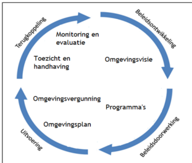
Figuur 1: De beleidscyclus

De Omgevingswet gaat uit van een dynamisch systeem van plannen maken. Geen vastomlijnde plannen meer voor een vaste tijd, zoals we gewend waren. De cyclus (zie Figuur 1 ) start met de kaders en ambities in een Omgevingsvisie. Deze werken door in programma's en in het Omgevingsplan en uiteindelijk in de vergunningverlening. Door te evalueren, beantwoorden we de vraag of doelen en ambities zijn gehaald. Waar nodig of gewenst, herzien we de visie om te kunnen bijsturen of aan te passen aan dan actuele vragen. Zo kan sectoraal beleid wat is opgesteld, verwerkt worden in de Omgevingsvisie. Of de Omgevingsvisie kan bijgestuurd worden omdat nieuwe, onverwachte ontwikkelingen of opgaven daarom vragen.