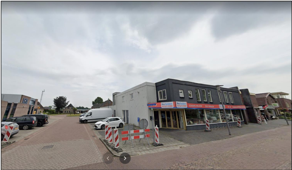
Afbeelding 4 Straatbeeld projectlocatie vanaf de Burg. Backxlaan met zicht op De Marke van Leusen