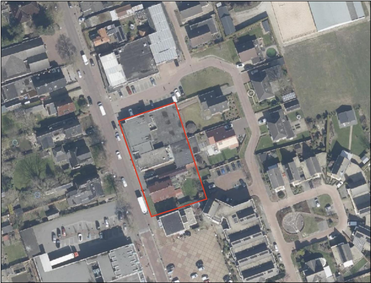
Afbeelding 2 Luchtfoto projectgebied