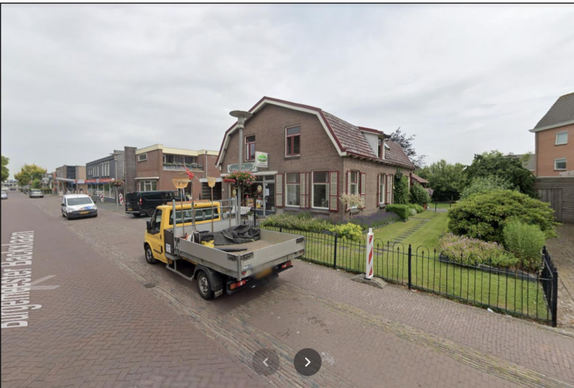
Afbeelding 3 Straatbeeld projectlocatie vanaf de Burg. Backlaan