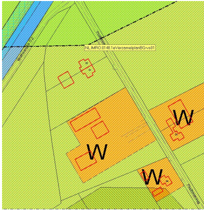
Buitengebied Dalfsen (2013)