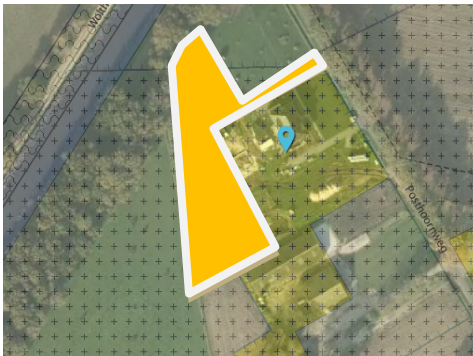
Ambtshalve aanpassing woonbestemming Posthoornweg 22-24: achtererf wordt in woonbestemming opgenomen. (gele vlak is toevoeging ten opzichte van ontwerp 2 e verzamelplan)