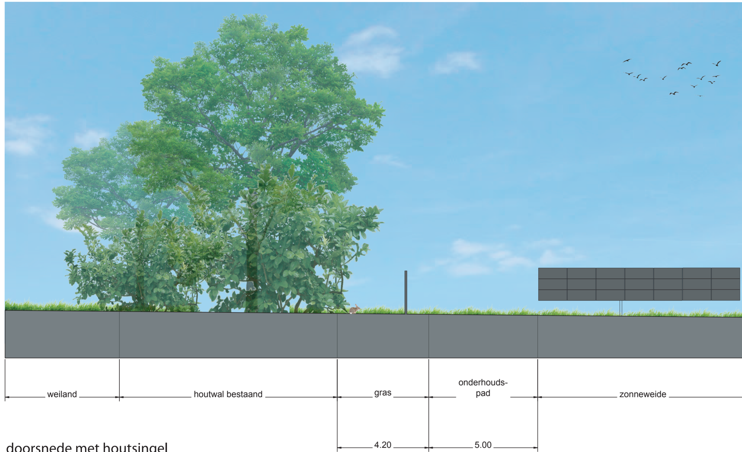
doorsnede met houtsingel