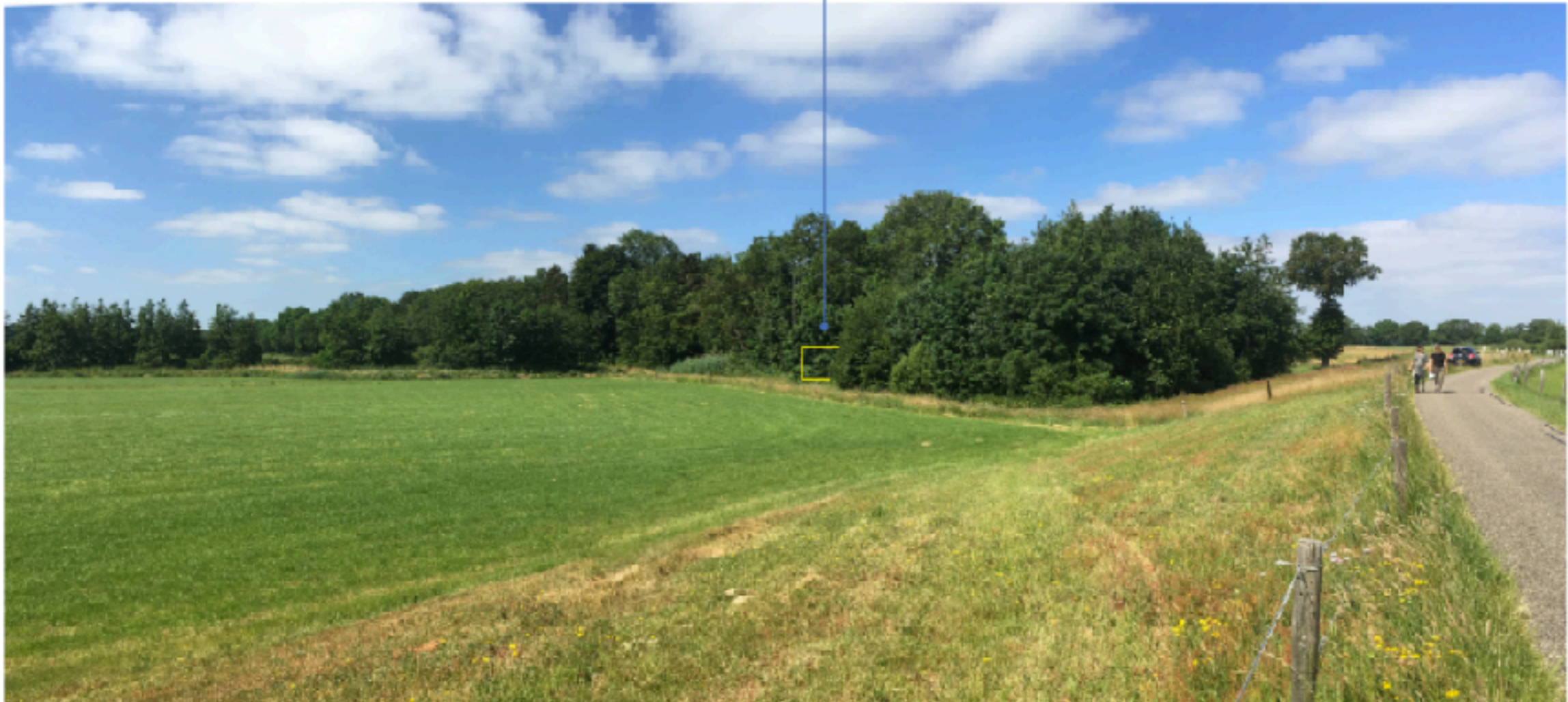
Locatie off-the-grid vakantiehuisje

De beoogde plaatsing van het off the grid vakantiehuisje zorgt voor een half verscholen ligging in de rafelrand van het bosperceel. Het huisje is deels zichtbaar vanaf de dijk maar valt door de natuurlijke kleurstelling weg tegen de achtergrond van bomen en struweel. Toegang en ontsluiting is - alleen te voet - mogelijk via het bestaande beheerpad. Parkeren kan op de bestaande parkeerplaats nabij de kolk. Het off grid natuurhuisje kijkt uit over de landerijen, waarbij de bosrand beslotenheid en beschutting geeft.