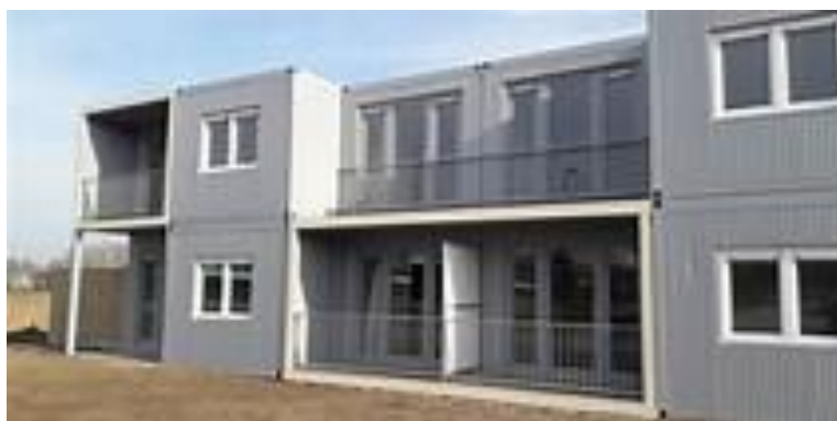
Containerwoningen in Zwolle