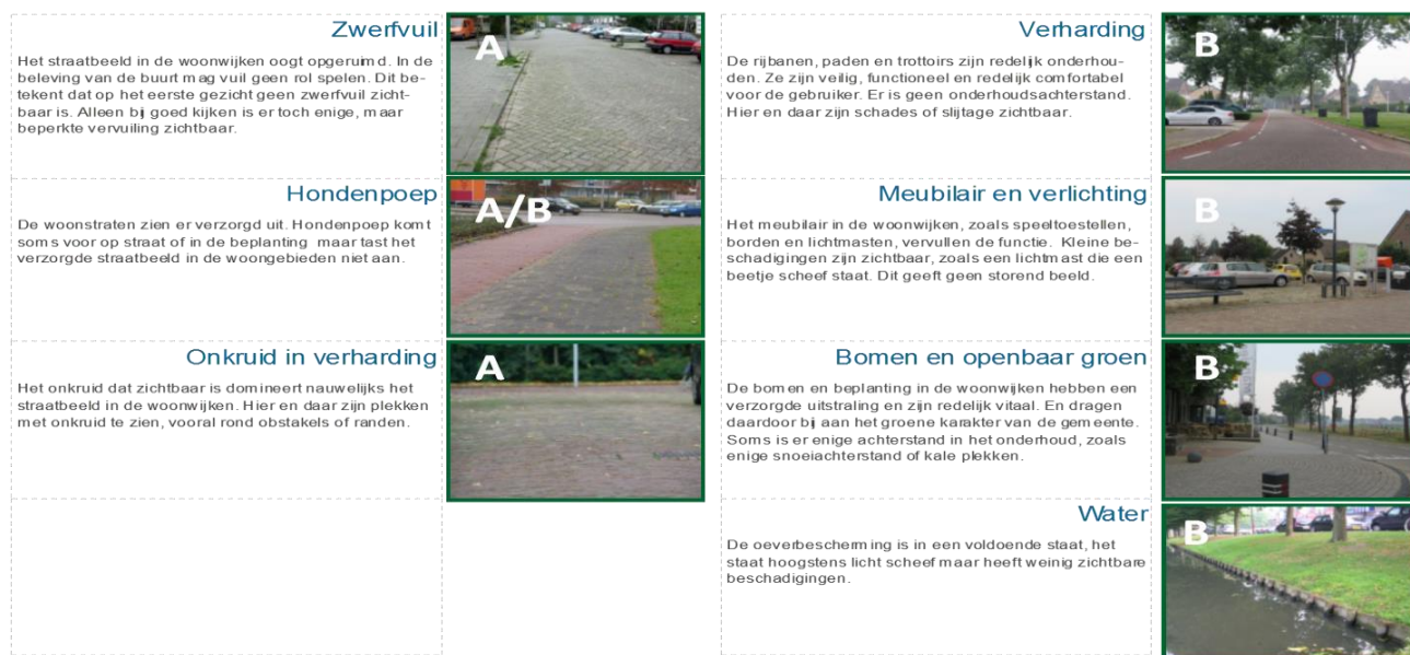
Figuur 1 toelichtings kwaliteitsniveau woonwijken (van toepassing zijn zwerfvuil, hondenpoep en meubilair)