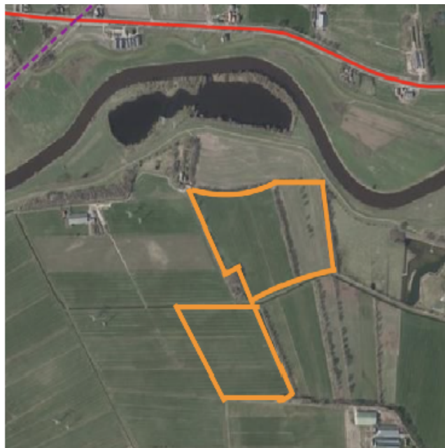
Huidige situatie planlocatie