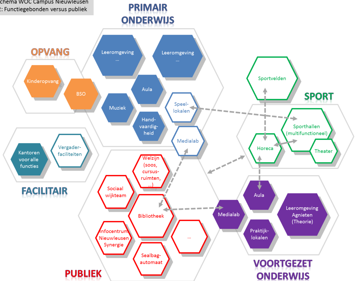
Relatieschema WOC Campus Nieuwleusen Model 2: Functiegebonden versus publiek