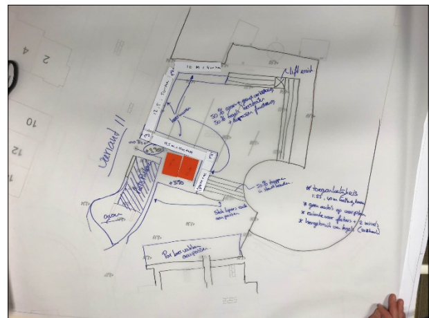
Optie 10. 'plein en hellingbanen aanpassen' Optie